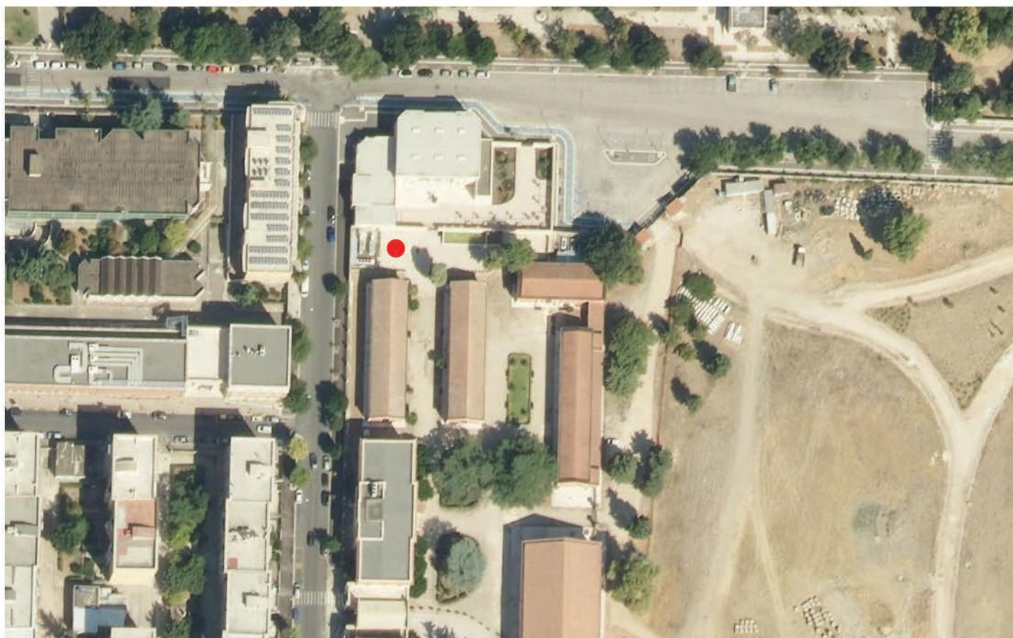
area libera in prossimità della Biblioteca

3 Sede: Dipartimento di Economia - Via Caggese: installazione di n. 2 ciclobox per 16 posteggi bici